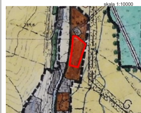
Teren objęty mpzp

Kopia Studium uwarunkowań i kierunków zagospodarowania przestrzennego gminy Złoty Stok Uchwałą Nr XXI/145/2020 z dnia 12.12.2020r