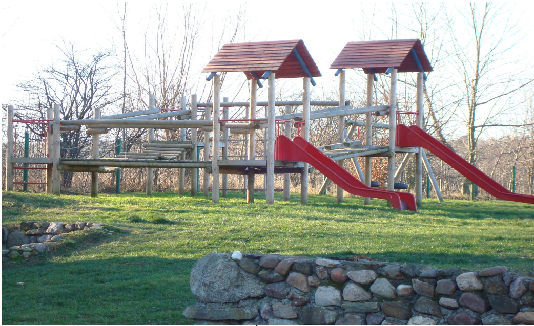
Fot.33 Plac zabaw przy Świetlicy Wiejskiej w Płonicy.