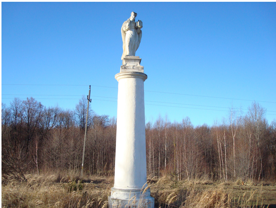
Fot. 7 Figura św. Jadwigi.

Przy szosie do Złotego Stoku stoi okazała, barokowa kolumna z końca XVIII w., zwieńczona figurą św. Jadwigi.