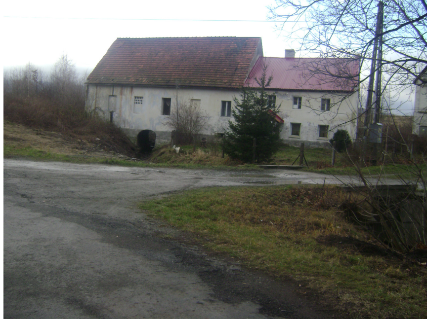
Fot.6 Dom nr 47 (dawny młyn).

Przy szosie do Złotego Stoku stoi okazała, barokowa kolumna z końca XVIII w., zwieńczona figurą św. Jadwigi.