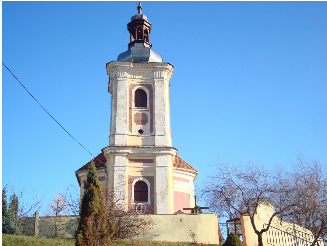
Fot.21 Kościół z przodu.