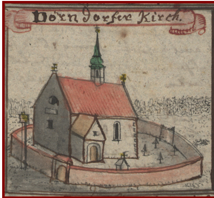
Fot.15 Pierwotny kościół w Płonicy wg rysunku B. F/ Wernhera