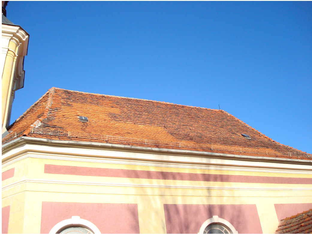
Fot.19 Stan dachu.