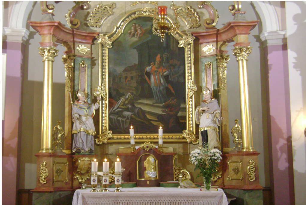
Fot.9 Ołtarz główny.