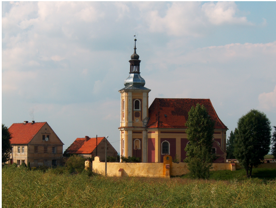
Fot.3 Kościół św. Mikołaja.

Najcenniejszym zabytkiem jest barokowy kościół filialny św. Mikołaja z 1777 r. Został wzniesiony według projektu Kaufmanna i należy do lepszych przykładów budowli sakralnych w okolicy.