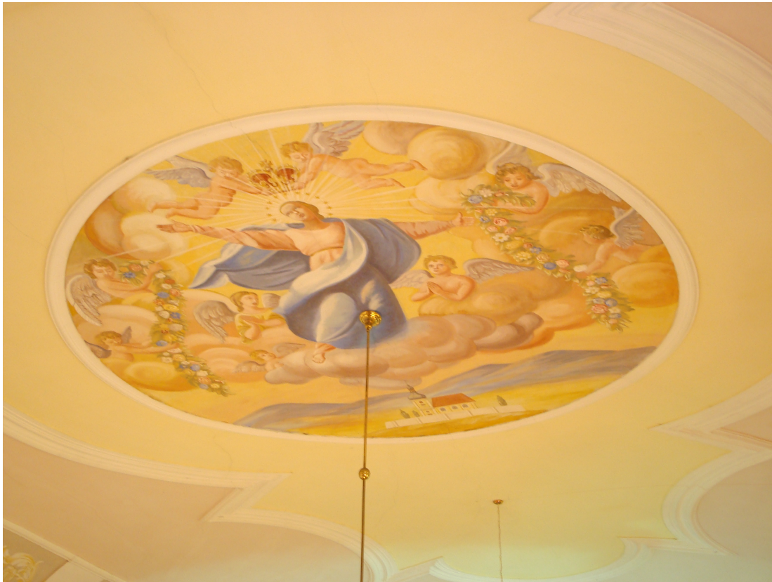
Fot.10 Plafon na suficie.

Na szczycie zwieńczenia znajduje się krzyż z glorią flankowaną symetrycznie przez dwa putta. Jednonawowy narzucie prostokątnym za ściętymi narożami, o łukowo wygiętej ścianie od strony ołtarza, mieści wewnętrzną eliptyczną nawę przekrytą kopulastym sklepieniem wspartym na pilastrach od południa, do nawy dostawiona jest zakrystia. Na osi stoi wieża, na rzucie kwadratu o wklęsłych ścianach, których efekt uzyskano poprzez wprowadzenie narożnych pilastrów. Okna zamknięte półkoliście, w opaskach z kluczami. Elewacje w podziale ramowym. Do wnętrza prowadzi w przyziemiu wieży kamienny portal o fantazyjnym wykroju z datą budowy w kluczu.