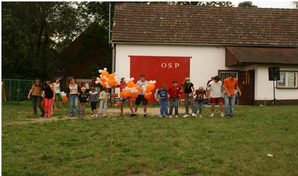
Fot.35 Impreza organizowana dla dzieci „Wakacyjne Harce”