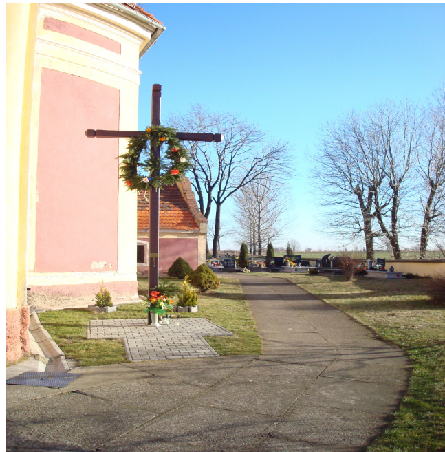
Fot. 16 Krzyż Misyjny.

Potrzebna jest wielka pomoc finansowa aby utrzymać świątynię kościoła w Płonicy. Poniższe zdjęcia przedstawiają jego wygląd obecnie.