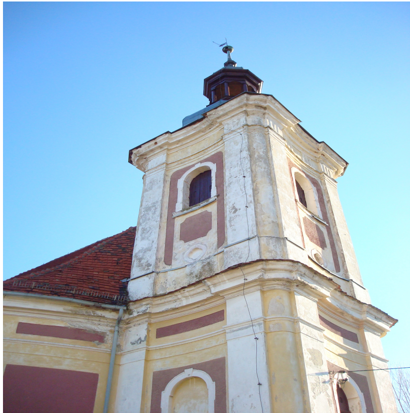
Fot.17 Wieża kościoła.