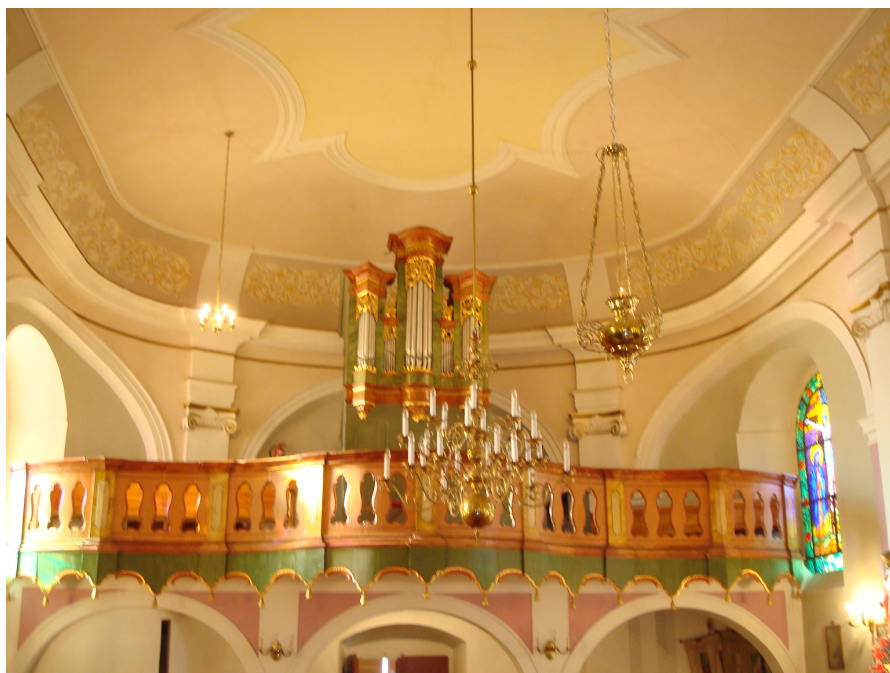
Fot113. Prospekt organowy w kościele.