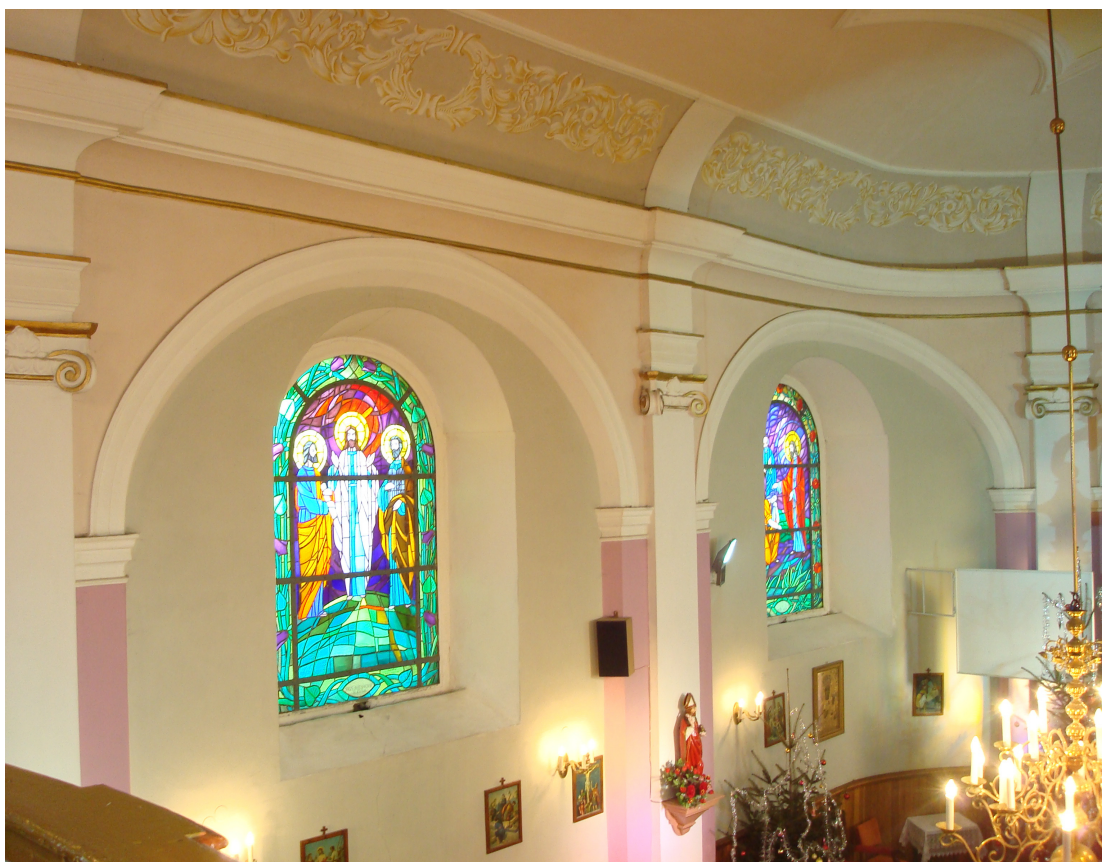
Fot.11 Okna w kościele.

Wewnątrz jednolite rokokowe wyposażenie z końca XVIII w, drewniana polichromia ambony, prospekt organowy figury, a także aparaty kościelne z tego okresu.