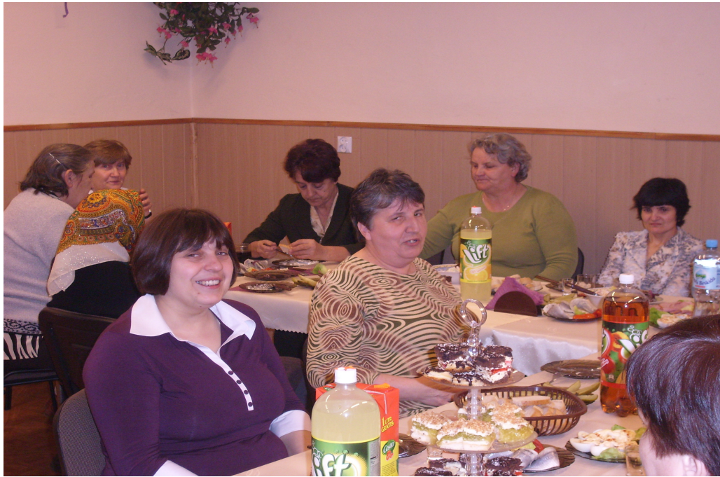
Fot.34. 8 marca w Płonicy.