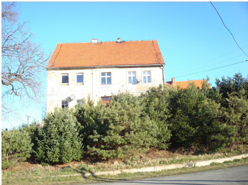
Fot. 5 Dom Nr 62 w Płonicy.