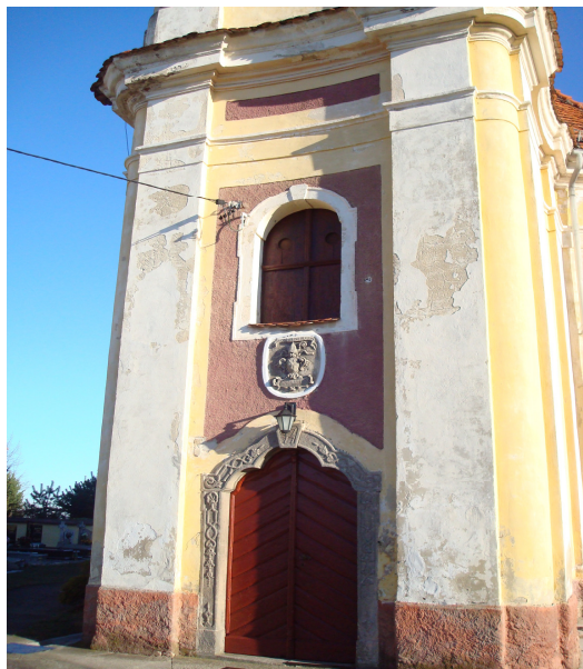
Fot. 8 Wejście do kościoła.

Kościół usytuowany na lekkim wzniesieniu wyraźnie króluje nad wioską, która wciska się w wąską dolinę. Pierwotnie z daleka można było dojrzeć białe lśniące w słońcu ściany kościoła oraz czerwony kryty dachówką dach. Dziś kolorystyka jest inna – bardziej korzystna dla bryły kościoła. Wzrok przyciąga również uroczy hełm wieży kościelnej wzbijający się w górę, dodający swoistego i jedyne w swoim rodzaju uroku architektonicznego na tle prostej wiejskiej zabudowy. Jeśli znamy okolice to na pierwszy rzut oka dostrzegamy wielkie podobieństwo do kościoła wybudowanego w Byczeniu. Zwięzłość ogólnego wyglądu, mimo strzelistości wieży, płaskie rozczłonkowanie ścian oraz szeroko wykrojone otwory okienne zdradzają tę samą rękę architekta i budowniczego. Przy bliższym i uważniejszym spojrzeniu dostrzegamy jednak znaczne różnice. Wschodnia i zachodnia część budowli nie jest kanciasta lecz zamknięta łagodnym łukiem. Do kościoła wchodzimy jedynym wejściem znajdującym się pod wieżą gustownie rozplanowanym przypominającym nie tyle przedsionek co krużganek.