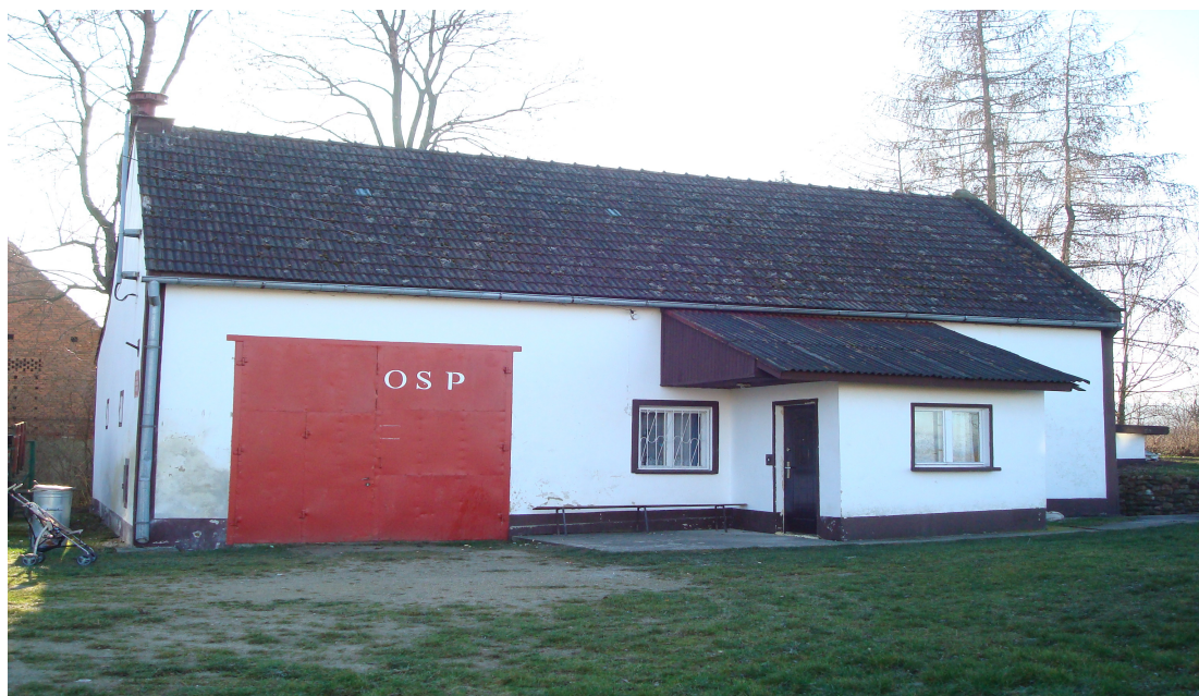
Fot.32 Remiza OSP w Płonicy.