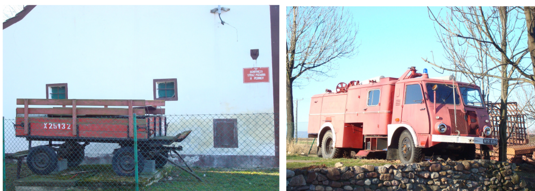
Fot.30 i 31 Zabytkowe wozy stojące przed Remizą OSP w Płonicy.

Wioska ma jedną niewątpliwą zaletę, w centrum wsi jest Remiza Ochotniczej Straży Pożarnej, wybudowana w latach 80 XX wieku przy dużej pomocy społeczności, w której zaplecze służy jako Świetlica Wiejska dla mieszkańców. Przy remizie jest również plac zabaw dla dzieci, boisko do gry w koszykówkę jak i również w siatkówkę.