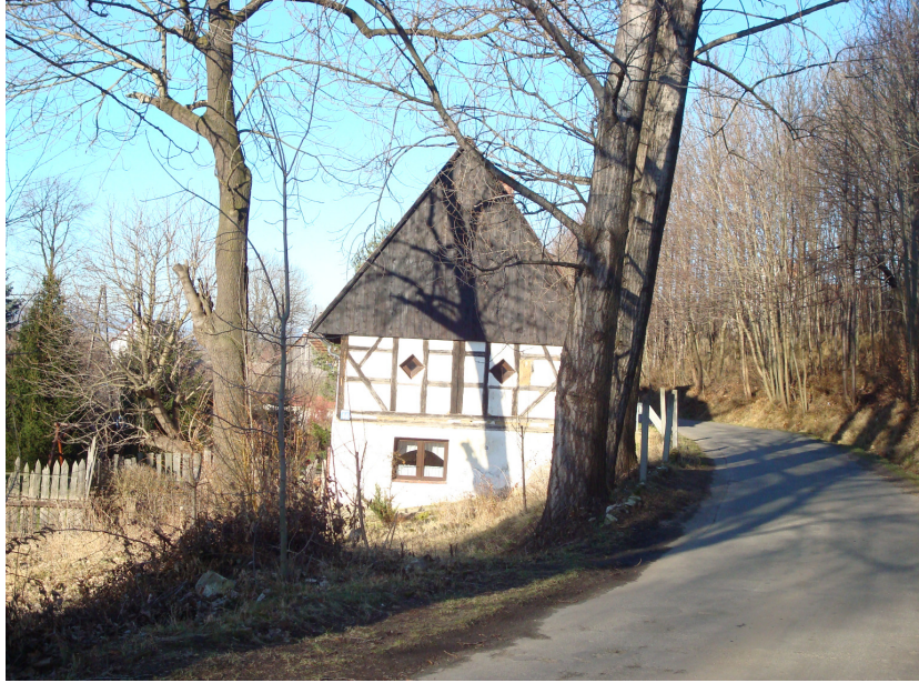
Fot.4 Dom Nr 44 w Płonicy.