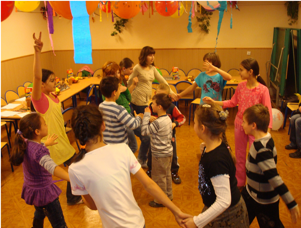
Fot.36 Zabawa Andrzejkowa.