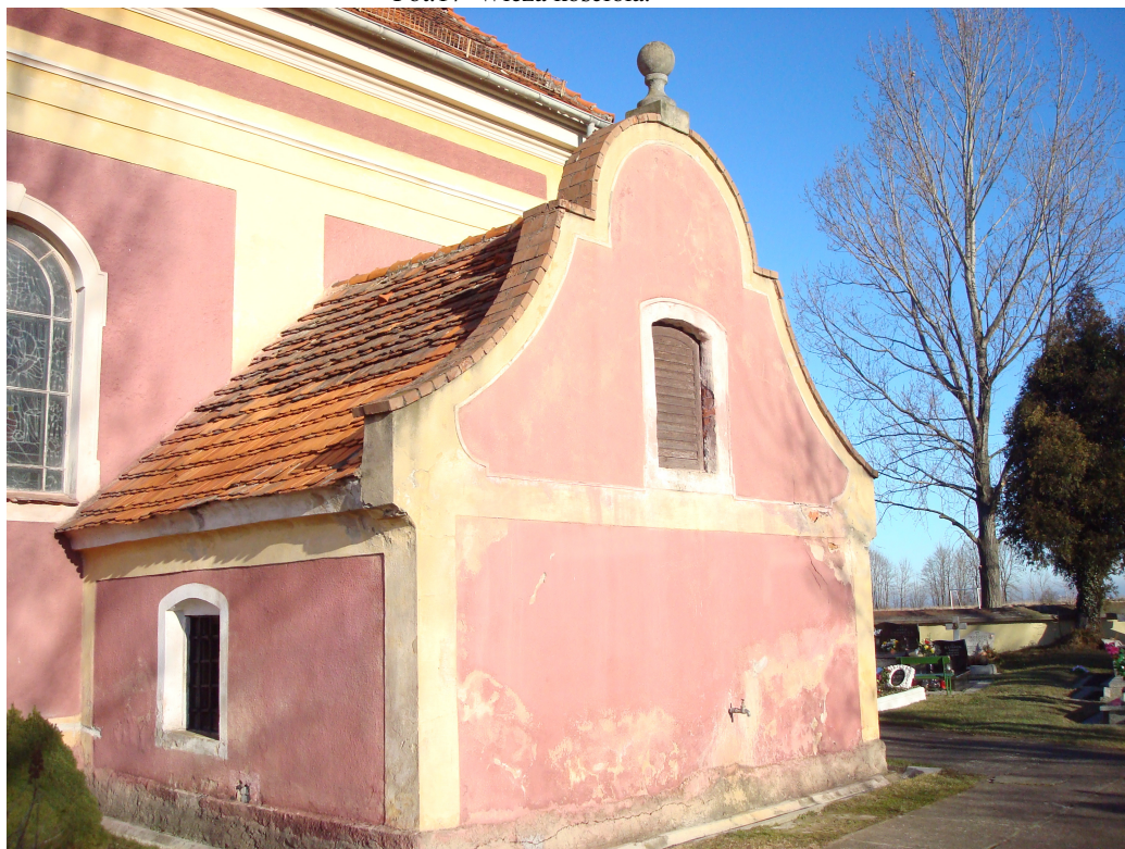
Fot.18 Ściana boczna.