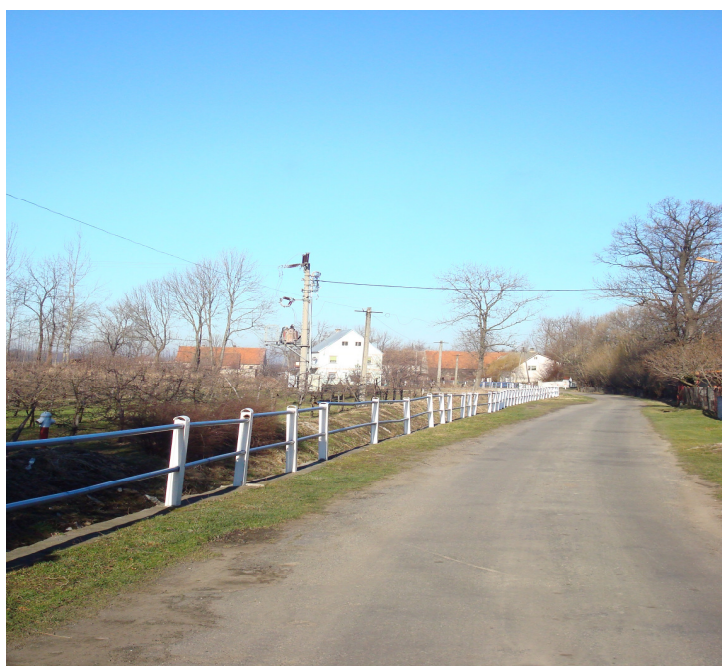
Fot. 2 Droga w Płonicy wzdłuż rzeki Świda.

Wieś można zaliczyć do osady typu łańcuchowego, położona w granicach 298 – 309 m. n.p.m., oddalona od Złotego Stoku o 4,2 km.