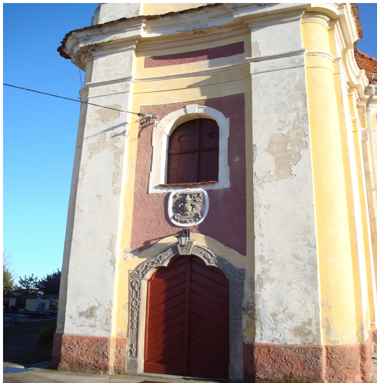
Fot.20 Wejście do Kościoła.